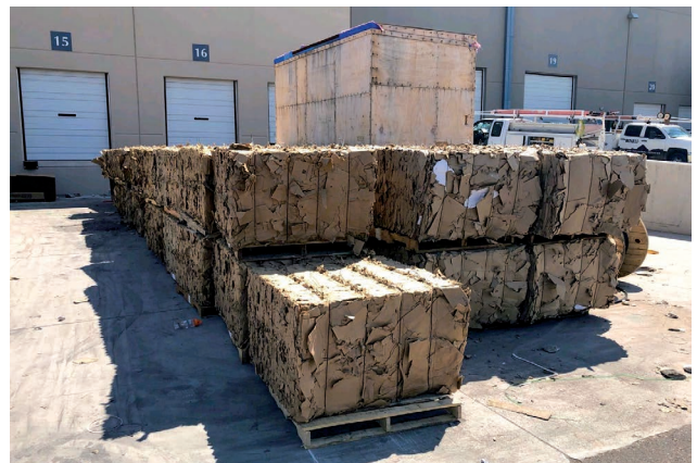
Grovolumige Kartons verarbeitet dank AVOS 1211+ZR-1380