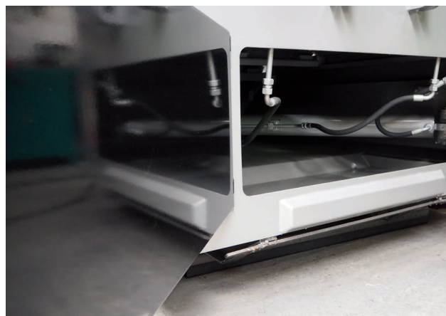
Cage à vérins autonettoyante avec bac de récupération