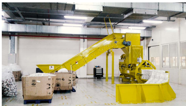
Version avec convoyeur à bande coulissante