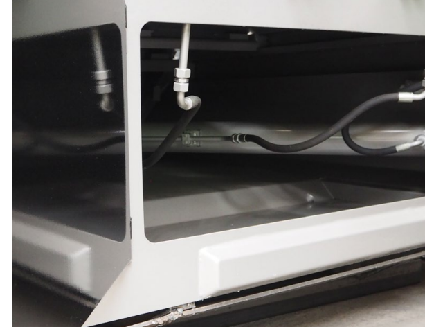
Selbstreinigungswanne im Presskopf