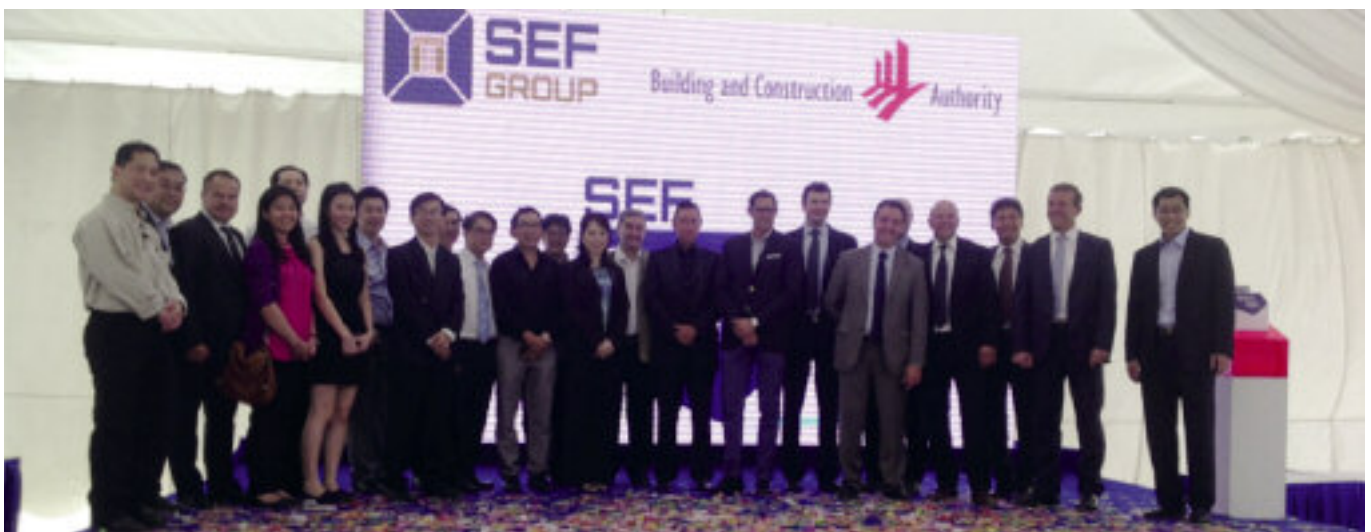
SEF Construction uruchomi w Singapurze w 2014 r. wielokondygnacyjne centrum prefabrykacji betonu.

Wizją rządu Singapuru jest zapewnić swemu narodowi szczęśliwą i wygodną przyszłość. Częścią tej misji jest pokryć w okresie 5 – 10 lat zapotrzebowanie ludności na mieszkania poprzez zbudowanie 700 000 nowych apartamentów, a nawet zwiększenie tę liczbę. Aby zrealizować ten cel na początku 2013 r. właściwy organ, mianowicie Urząd ds. Budownictwa i Konstrukcji (BCA) ogłosił przetarg na pierwsze centrum prefabrykacji. Wymagania przetargu obejmowały w głównej mierze aspekty oddziaływania na środowisko i nowoczesne technologie produkcji, a także analizy kosztów i innowacje w zakresie technologii prefabrykacji betonu.