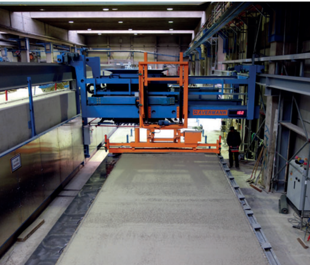
Betonverteiler in Brückenausführung mit Abziehvorrichtung

Neben Selbstverdichtendem Beton (SVB) wird auch Normalbeton verarbeitet. Dafür steht ein Betonverteiler in Brückenausführung zur Verfügung, welcher über eine Kübelbahn beschickt wird und zwei Arbeitsplätze bedient. Inklusiv diverser Zusatzausrüstungen am Betonverteiler – u. a. sind hier auch absenkbare Flaschenrüttler installiert – und der an einer Station installierten HF-Verdichterstation lassen sich alle vorgegebenen Betone austragen und verdichten. Für das unmittelbare Glätten der Betonoberseiten ist eine höhenverstellbare Abziehvorrichtung an der Betonverteilerbrücke angebaut.