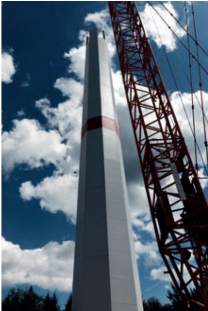
Patentierter Ventur-Hybridturm für Windkraftanlagen

Nach vielen Jahren der Herstellung von Betonfertigteilen auf Kipptischen und stationären Fertigungsbahnen entschloss sich die Benno Drössler GmbH & Co. Bauunternehmung KG in Siegen, die bewährte Fertigung durch den Einsatz einer Palettenumlaufanlage zu optimieren. Im Herbst 2013 wurde das Konzept mit allen Detailanforderungen spezifiziert, anschließend ausgeschrieben und bei verschiedenen Anlagenherstellern Angebote eingeholt. Die Firma Avermann erhielt den Zuschlag zur Lieferung der Palettenumlaufanlage, im Paket mit dessen Unterlieferanten SAA Engineering für die Prozess- und Umlaufsteuerung mit Leitsystem.