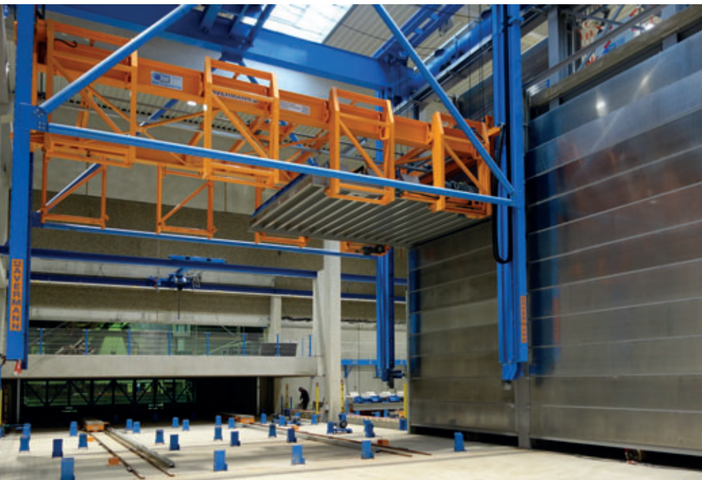
Regalbediengerät für Härtekammerbeschickung

Nach dem vollautomatischen Auslagern – dieser Bereich ist entsprechend mittels Zaunabsperungen sowie durch Lichtschranken/Mutingsystem abgesichert –