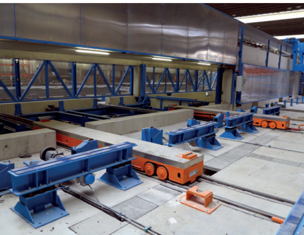
Zentralverschiebebühne mit Querhubwagen bei der Einfahrt in die Verdichterstation