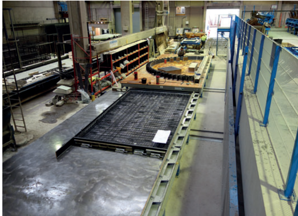
Abb. 5: Schalungs- und Bewehrungsstationen für Massiv-/Sandwichwand und Sonderteile

Die Bauteilbewehrung wird bei Drössler in einer separaten Halle vorgefertigt und palettenbezogen für den weiteren Einbau an die Bewehrungsstationen geliefert. Alle Arbeiten für die Ventur-Produktion werden auf den hinteren Plätzen geleistet. Somit ergeben sich keine Beeinflussungen für die übrige Produktion. Aus demselben Grund erfolgt auch das Betonieren an mehreren Stellen.